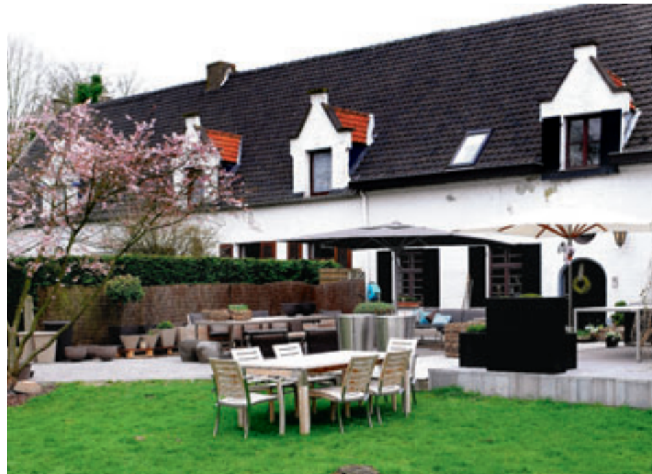
De kasteelhoeve dateert van 1847. De bewoners creëerden de look en het gevoel van een loft, maar met respect voor het verleden.