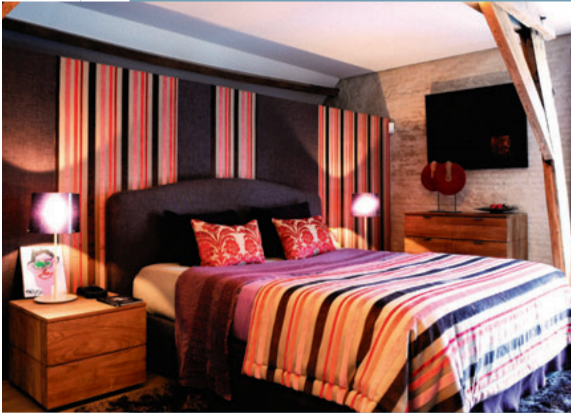
Het bed harmonieert met de achterliggende wand door het hernemen van dezelfde stoffering als het bedlinnen van Libeco en Society.