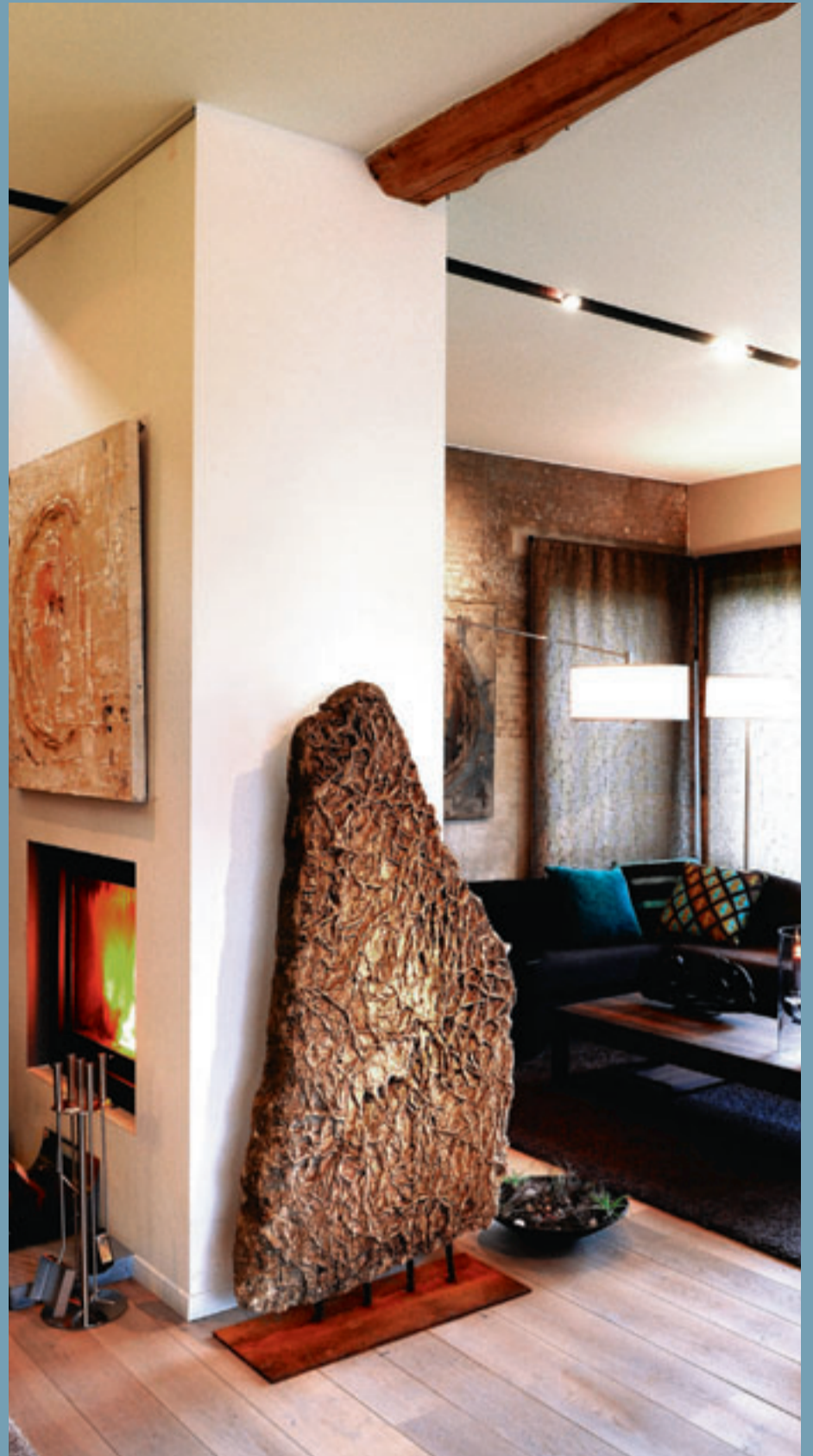
Rivierstenen op sokkels geven de woonkamer een authentiek karakter.