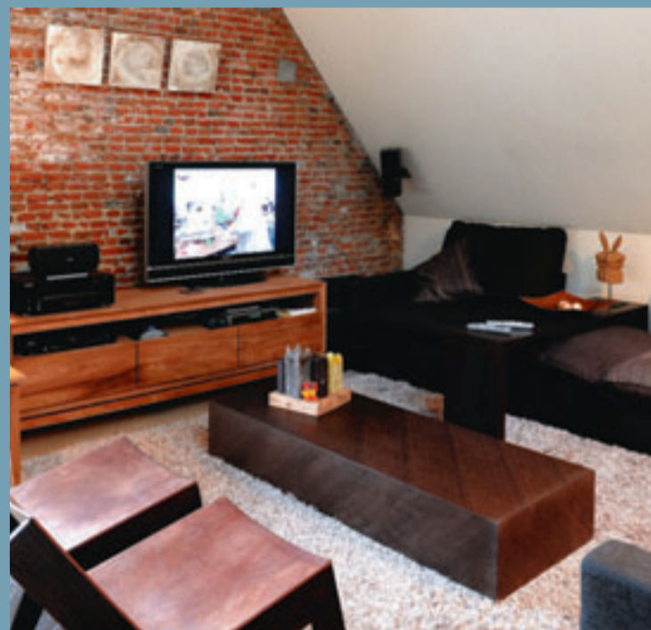
In de tv-hoek werd de ruwe rode baksteen bewaard, voor de afwisseling. De hoekbank is een ontwerp van Wim Segers.