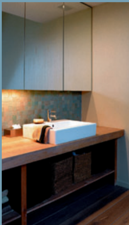
De badkamer werd uitgevoerd in wit geoliede eik en Marokkaanse tegels.