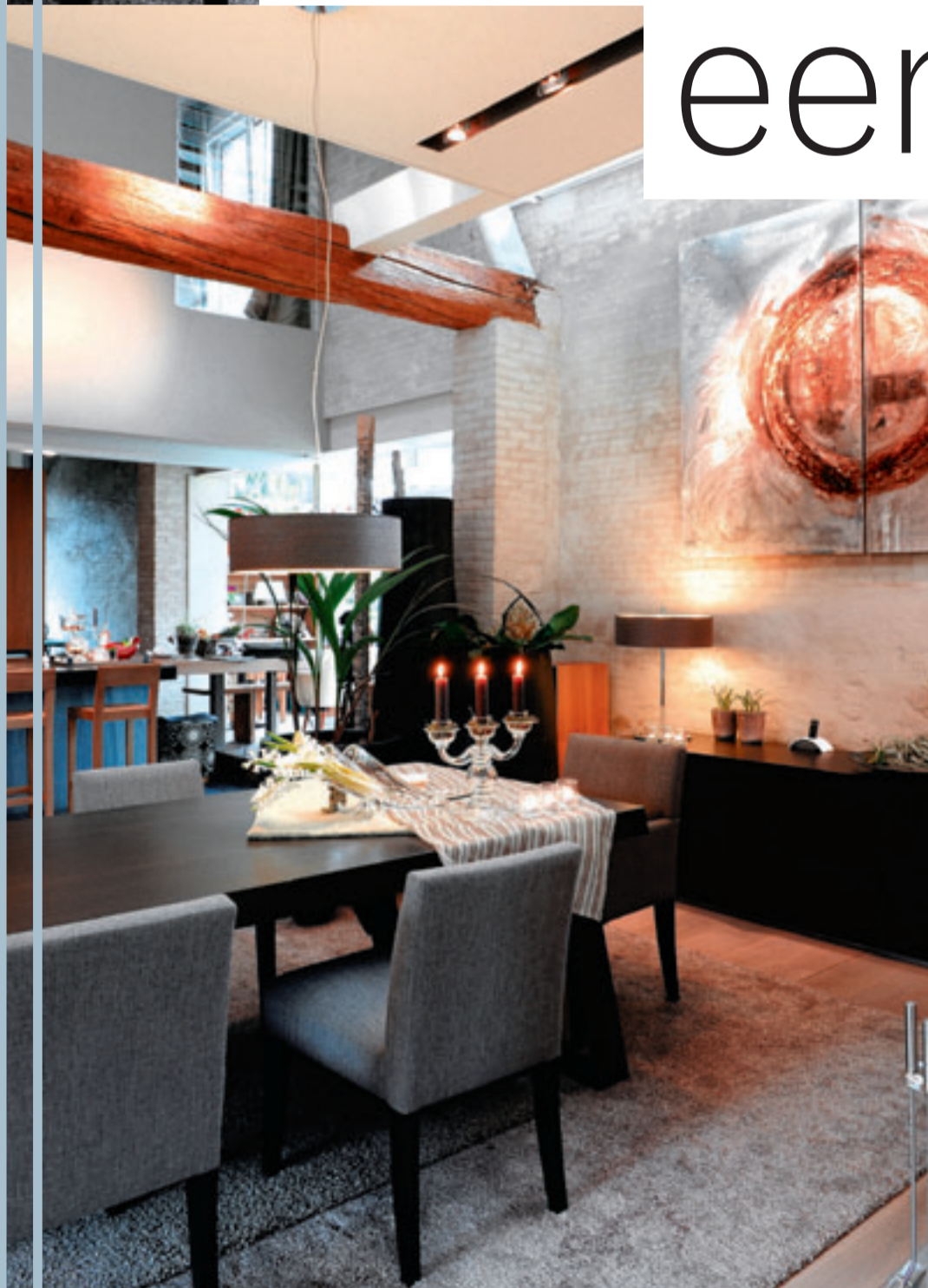
Zowel in het salon (foto boven) als in de eetkamer vind je een combinatie van design (Indera en Interni) met kunst van Sabine Maes.